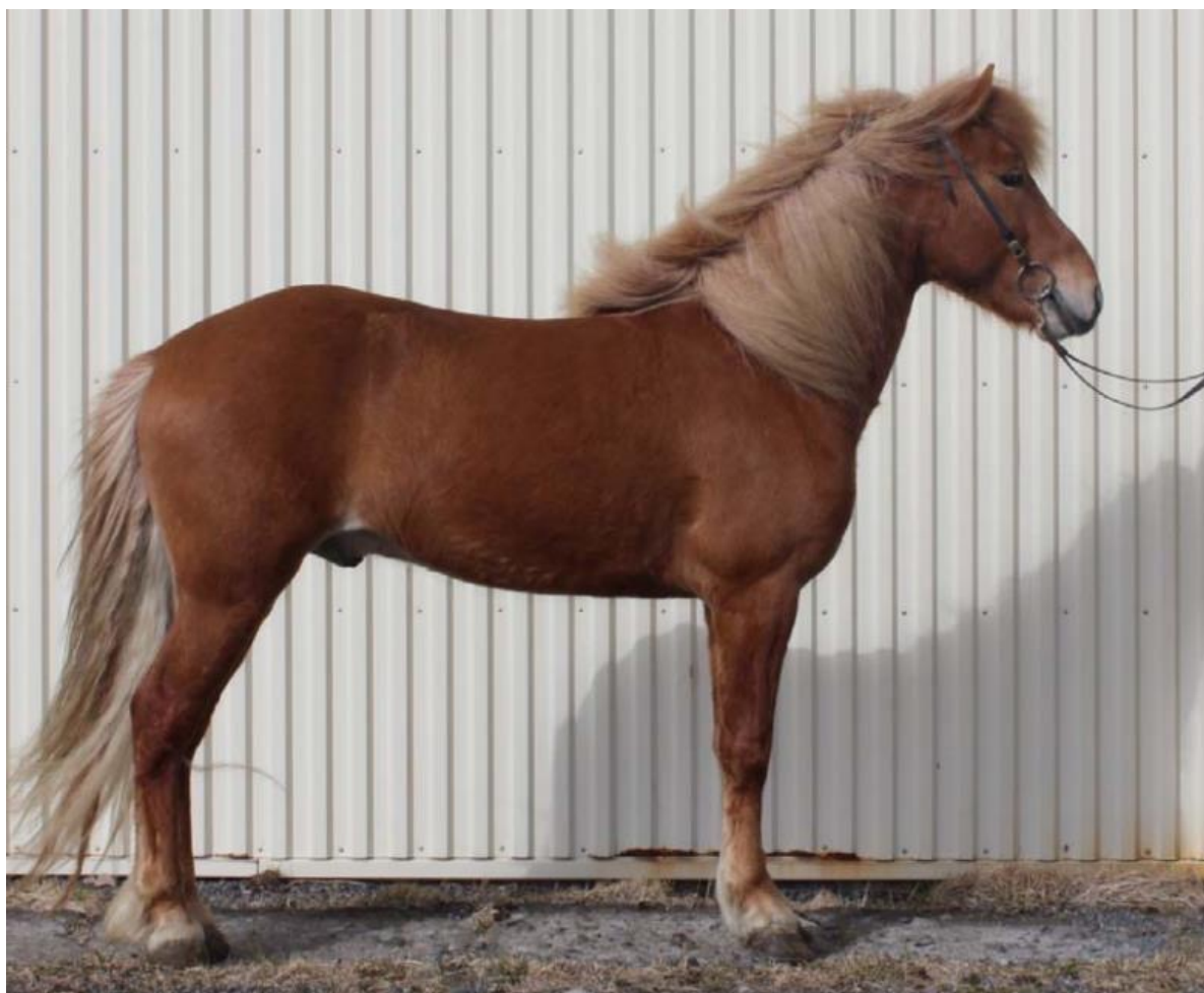
Ideell oppstilling for bygningsdom. Frambeina og bakpipene er vertikale.

Hesten skal stå jevnt med alle fire bein. Frambein skal være vertikale, og bakbein skal være plassert slik at bakpipen er vertikal (se bilde). Hesten skal stå noenlunde jevnt med begge bakbein (en forskjell på inntil én hovlengde er tillatt). Tanken bak det at alle hester skal stå likt er for å forsøke å skape en stabilitet i bedømmingen av eksteriøret, og gi dommerne bedre muligheter til å se hestens naturlige beinstilling i profil, så vel som rygg og kryss. Hesten bør være våken og konsentrert, men samtidig rolig og avslappet. Det er forbudt å føre hesten under bygningsbedømmingen.